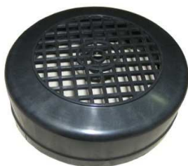
Lüfterhaube BR250 Art.Nr.: 49/35