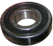
Rillenkugellager KK-Seite Welle Ø 28 ab Februar 2017 Maschine 08170133 Art. Nr.: 42/16