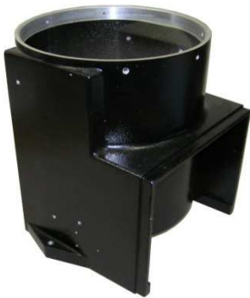
Gehäuse Art. Nr.: 43/28