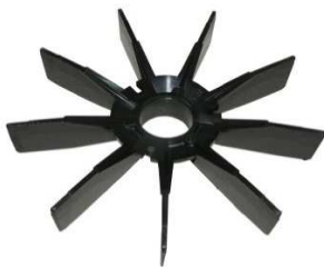
Lüfterflügel BR250 Art.Nr.: 49/34