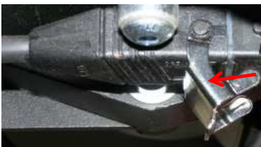
Wiedereinschaltsperrgerät Bügel Art. Nr.: 40/54