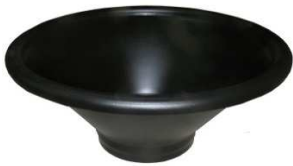
Einfülltrichter ohne Bürste Art. Nr.: 43/37