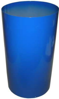
Einfüllzylinder Art. Nr.: 43/31