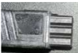
Wiedereinschaltsperrgerät Leitungsdose incl. Kabel Art. Nr.: 40/51